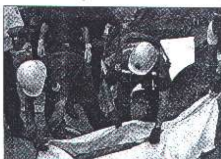
En lo que va de año se han contabilizado 16 víctimas fatales