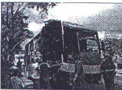
En este año ha aumentado el número de colectivos involucrados en accidentes viales

Y recordó, que lamentablemente nunca se ha dado uso a un conjunto de recomendaciones incluidas en el Primer Estudio de Accidentes de Tránsito en Autobuses Turbancos de Pasajeros entre 1981 y 1995 que publicó en esa oportunidad.