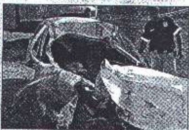
La imprudencia y la falta de señalización han incidido para que las calles tuyeras se liben de sangre

Las fallas que presentan estos vías son la falta de islas, señalizaciones y alumbrado público. Asimismo son visibles los huecos, baches y fallas de borde, lo cual unido al exceso de velocidad y la imprudencia de conductores se convierten en un cóctel de la muerte. Esta grave situación es del conocimiento de las autoridades gubernamentales, pero hasta ahora es poco lo que se ha hecho